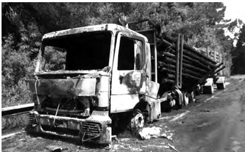
Contulmo, 4/11 camion de l'industrie forestière