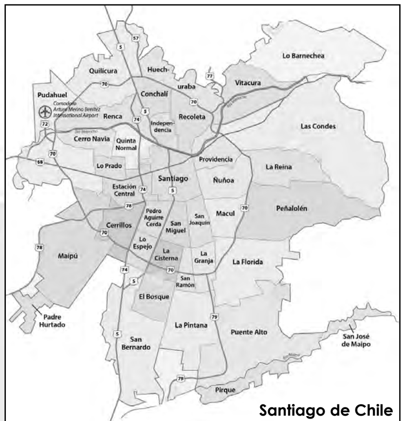
Santiago de Chile