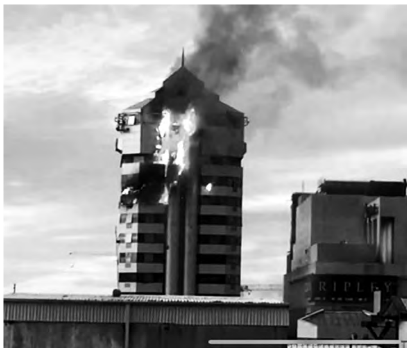
Concepción, 2/11 les bureaux du service électoral dans la tour Caja de los Andes

Verde) ont reporté 197 d'entre elles pillées, dont plusieurs réduites en cendres. Du côté des écoles, le ministère a listé 20 écoles saccagées et hors d'usage, dont deux incendiées (à Lo Espejo et à Catemo). Enfin, du côté des super