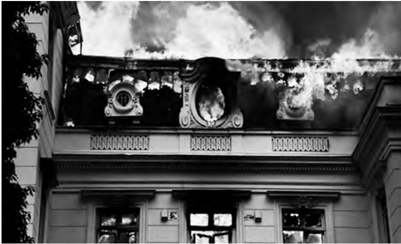
Santiago, 8/11 incendie de l'université Pedro Valdivia

sont cette fois des entreprises d'exploitation forestière qui ont été prises pour cible : la nuit de mercredi à jeudi à Tirúa (plusieurs bâti-