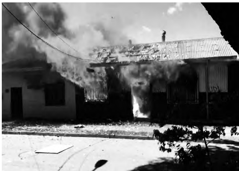
Cañete, 2/11 la permanence du sénateur UDI

A chacun.e de voir comment ici aussi étendre le feu contre un même monde d'oppression et de domination, et pourquoi pas offrir un peu d'oxygène aux feux de la révolte chilienne.