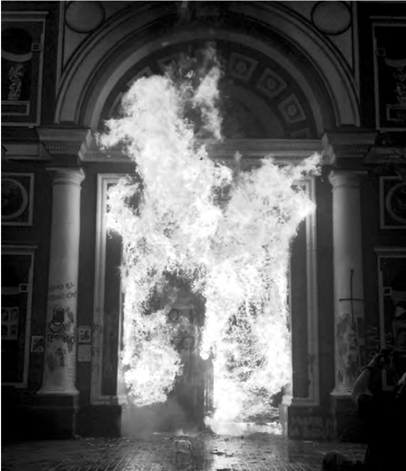
Santiago, 12/11 Iglesia de la Veracruz

canon, ou que d'autres ont grimpé aux mâts pour détruire des caméras de vidéosurveillance. Au cours de cette importante émeute sauvage où les anarchistes n'ont pas été en reste, d'autres objectifs de choix ont été attaqués : le siège national du parti UDI situé à