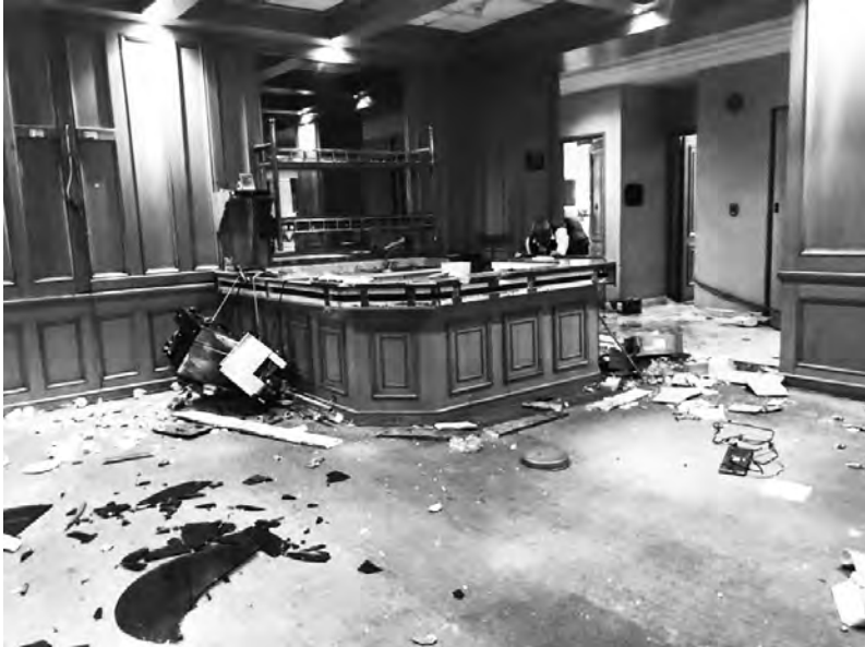
La Serena, 27/11 saccage de l'hôtel de luxe Costa Real

Politicailleries. Ce lundi se réuniront les partis d'opposition et du gouvernement dans