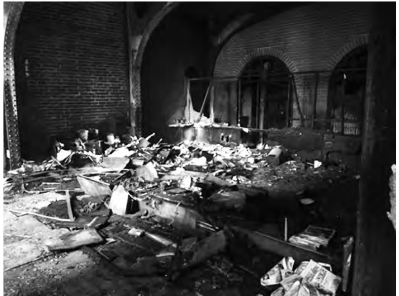
Valparaíso, 20/10 siège du journal El Mercurio incendié

blés sous le nom Unidad Social pour un seul jour, mercredi, demandant de d'abord retirer les militaires de la rue (et même pas cet autre minimum qui est la libération de tous les incarcérés) avant « d'ouvrir un dialogue social ».