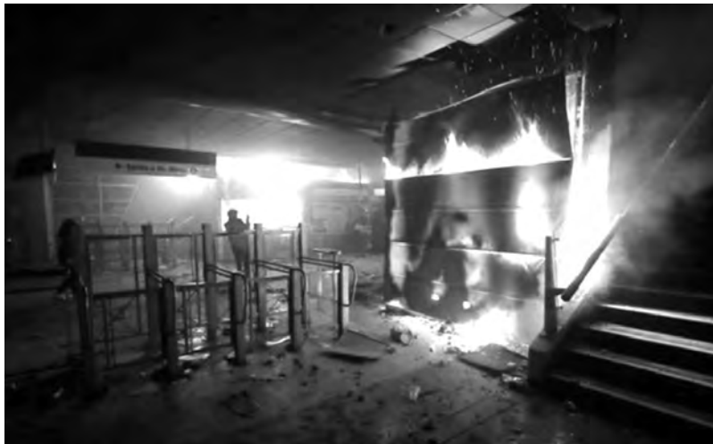
Santiago, 18/10 station de métro de la ligne 4

restreignant les libertés de mouvement et de réunion et en autorisant les militaires à descendre dans la rue pour rétablir l'ordre. Tous les rassemblements publics sont désormais interdits : à titre d'exemple, l' Asociación Nacional de Fútbol Profesional (ANFP) a immédiatement annoncé la suspension de tous