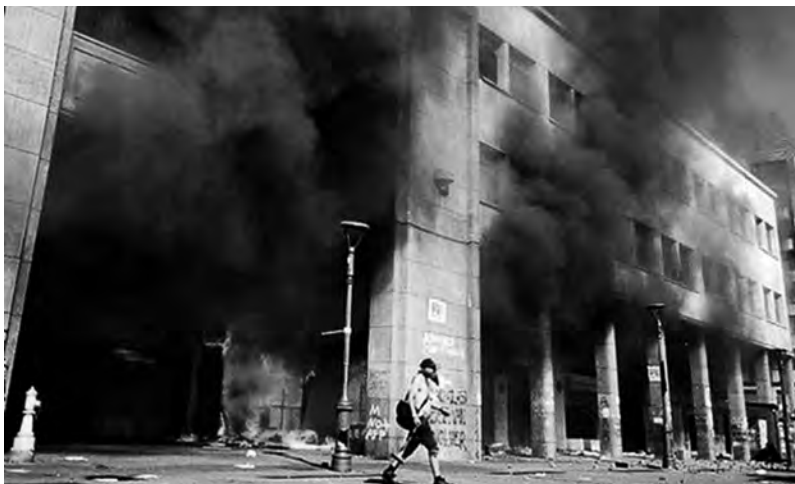
Concepción, 12/11 plusieurs services de la Préfecture régionale partent en fumée

Côté chiffres, le ministère chilien de l'économie a précisé que pour l'instant ce sont 677 commerces qui ont été pillés et incendiés, et que 30% des supermarchés sont bien hors service suite à ces attaques (soit 344 d'entre eux). De son côté, le directeur du Transporte Público Metropolitano (DTPM, région du Grand Santiago), a ajouté que 24 bus avaient été incendiés, 1300 « vandalisés »