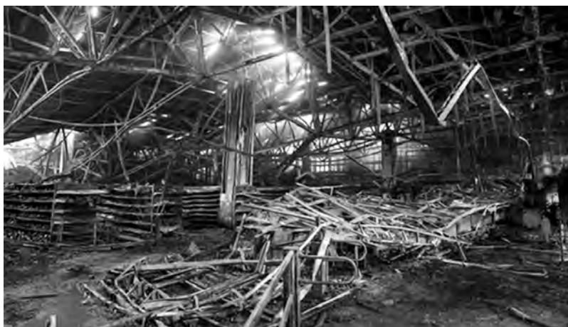
Valparaíso, 20/10 hypermarché incendié

cela. « Nous sommes en guerre contre un ennemi puissant, implacable, qui ne respecte rien ni personne et qui est prêt à faire usage de la violence et de la délinquance sans aucune limite » a ainsi déclaré Piñera lors d'une conférence de