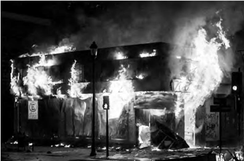
Punta Arenas, 12/11 fonds de pension AFP Habitat

de la révolte, il y a eu une fois de plus des saccages au centre ville, avec par exemple une boutique Johnson's dont le mobilier a servi de combustible pour une barricade, et idem à Copiapo, Los Andes (avec pillage d'un supermarché Santa Isabel ), Rancagua ou Nogales (avec pillage de camions bloqués), tandis qu'à San-