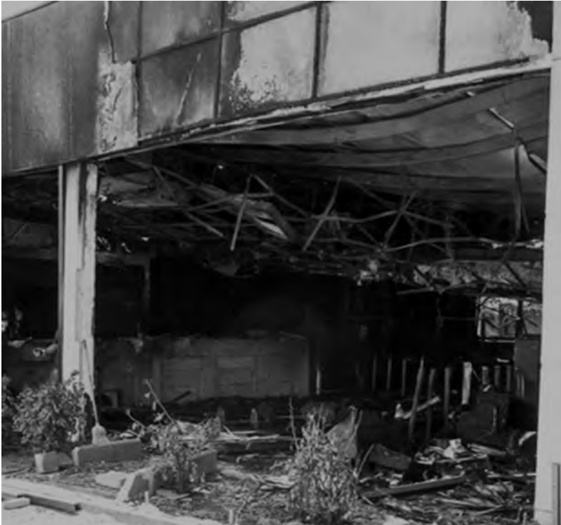
Cerro Navia, 17/11 restes d'une agence Banco Estado incendiée

l'entrepreneur José Menéndez, un des grands responsables de l'extermination totale de la population Selknam en Patagonie (disparue au début du 20 e siècle), qui se fracasse au sol. A Maipú (Santiago) le 19 novembre, c'est le canon du monument à la gloire de l'Indépendance (célébrant la bataille de Maipú de 1818) qui a été descellé et balancé au sol quelques mètres plus bas.