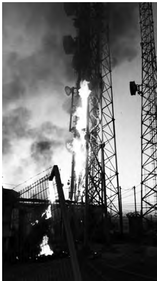
Caldera, 12/11 antenne de téléphonie mobile Movistar